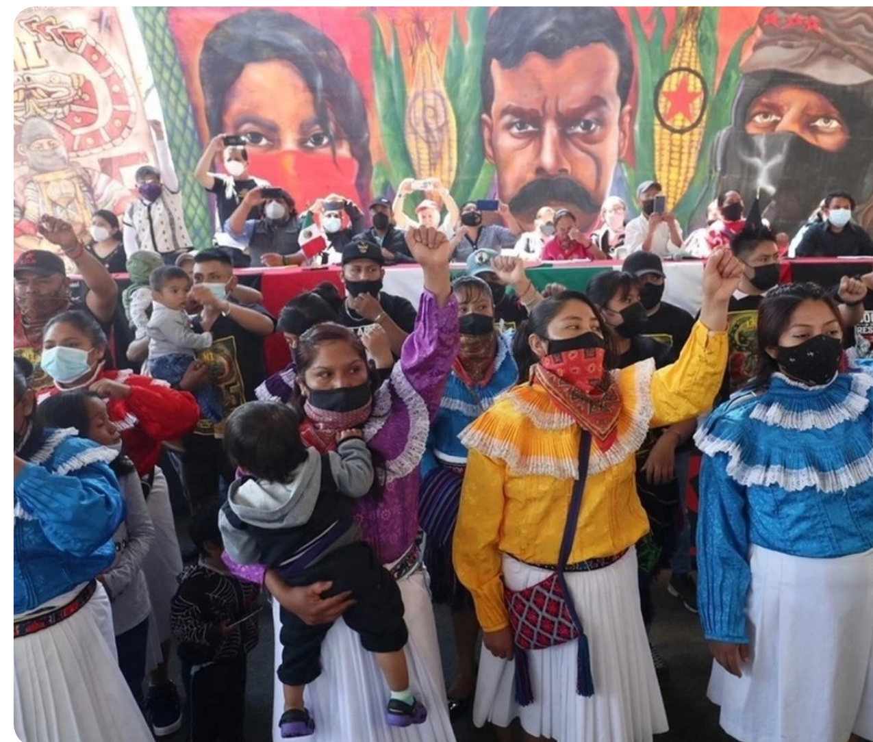
Crédito de imagen: Integrantes de movimiento indígena en CDMX en imagen de archivo. Foto Luis Castillo. La Jornada.